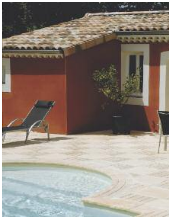
Doc. Pierre reconstituée de France

Superbes reproductions des caillebotis en bois vieilli, les dalles et margelles en Pierre reconstituée de France confèrent style et confort aux plages de piscines, la facilité d'entretien en plus !