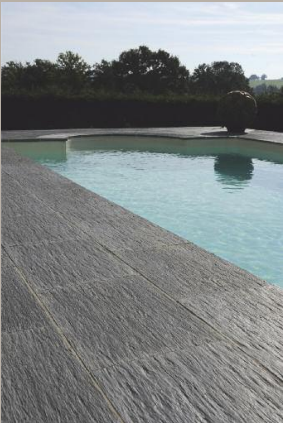
Doc: Pierre reconstituée de France

Issus d'un procédé technique de pointe, les dallages et margelles de piscines en Pierre reconstituée de France, autorisent des agencements à la fois résistants et particulièrement esthétiques, en imitant des matériaux recherchés en décoration comme l'ardoise.